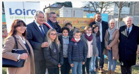
Pose de la première pierre le 3 décembre 2021.