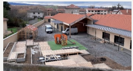
Le Pôle Enfance Jeunesse le 23 décembre 2022